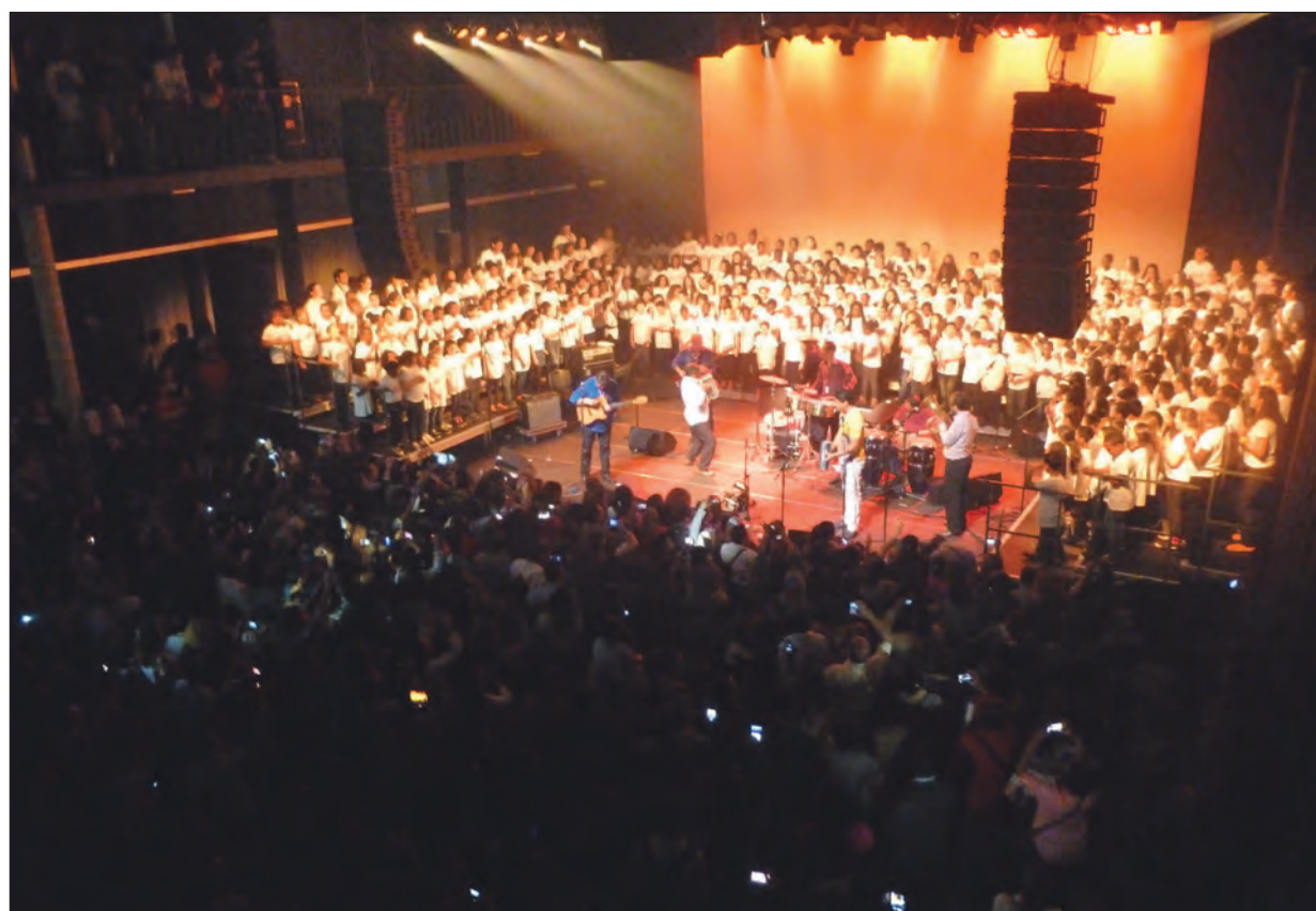
450 voix d'écoliers résonnent aux couleurs de la Colombie dans la salle de l'Embarcadère à Aubervilliers.

Chaque année, l'association villes des musiques du monde organise un festival qui se déroule en automne pendant quatre semaines. Entre deux festivals, des ateliers de création s'organisent avec les écoles du département. C'est aussi une façon de faire perdurer l'aventure musicale « Colombie, mon Amour » proposée à l'automne dernier. Tous les ans, l'occasion est donnée pour découvrir un des quatre coins de la planète. Avant la Colombie, la musique malgache et l'artiste Rajery