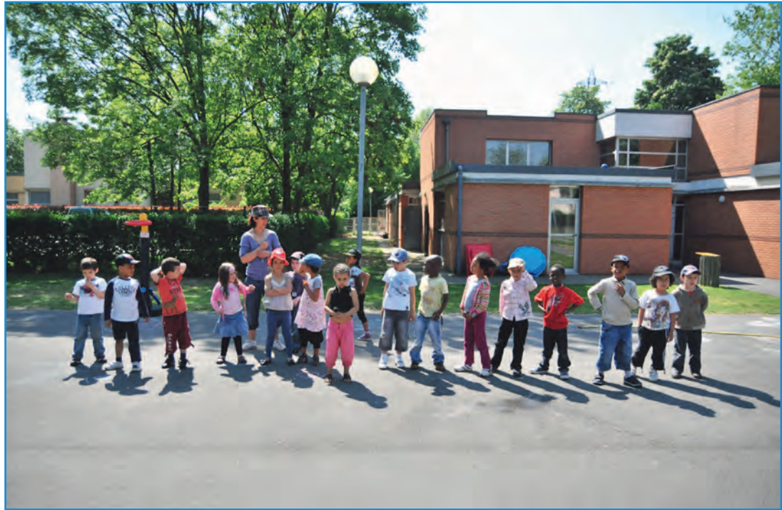
Activités de plein air au centre de loisirs Robinson en avril 2011.

La Ville propose différents services : accueil du matin, accueil le soir, restauration scolaire. Afin d'accueillir au mieux les enfants, il est obligatoire de procéder à une inscription administrative à ces services.