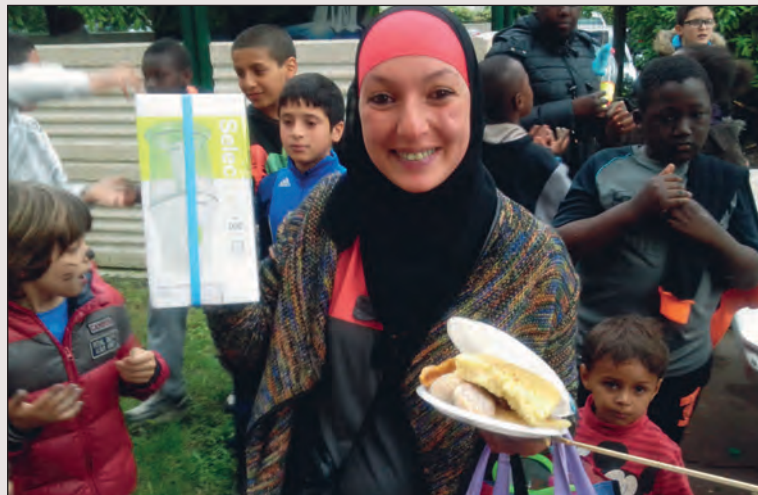
Langevin fête ses voisins ! Entre voisins, les habitants de la cité Langevin ont organisé un moment convivial avec notamment un concours de gâteau comprenant des lots à gagner après la dégustation et une fresque-graff réalisée sur place...