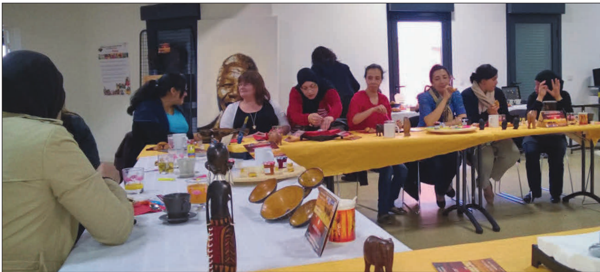
Durant un café des parents, début mai, au centre socioculturel Clara-Zetkin.

Les mots qui tuent... arrêtons le massacre ! Telle était la thématique du premier Café des parents, initiée par l'Association des parents d'élèves Jules Verne au centre socioculturel Clara Zetkin. Tous les mardis, on discute parentalité. Le 13 mai, une vingtaine de parents, surtout des mamans, se sont réunis pour échanger autour d'un petit déjeuner.