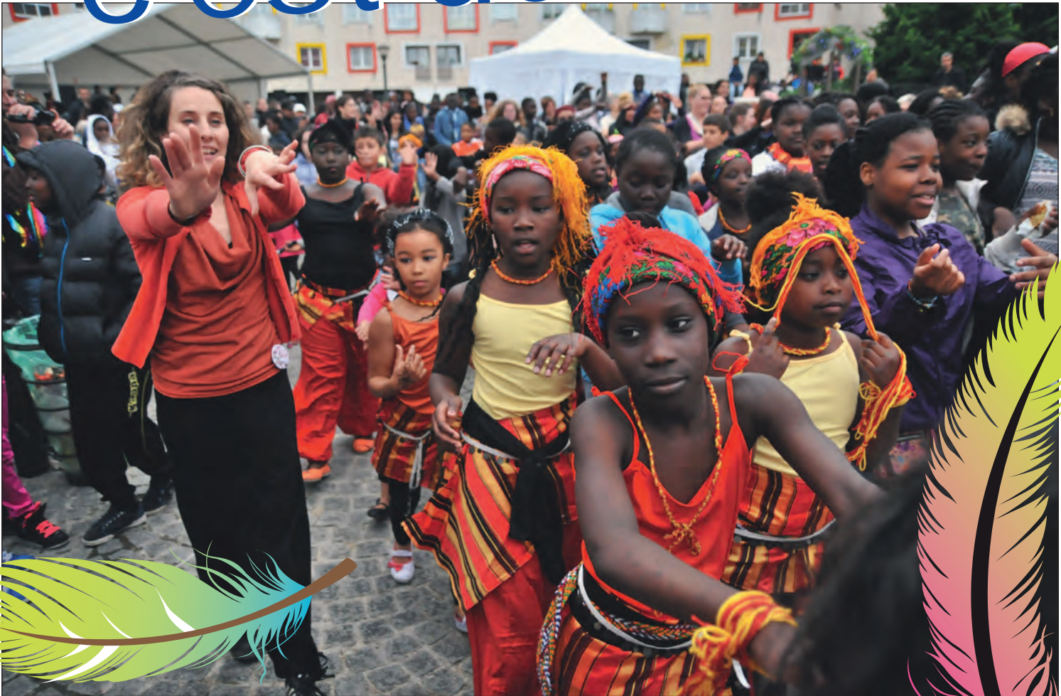
Fête de la ville 2013, durant la flashmob dansée. Cette année, il s'agira d'une flashsong que le public entonnera avec une chanson d'Amel Bent et un air Brésilien (voir page suivante).

Le samedi 21 juin, c'est la 5 e édition de la fête de la ville, un événement initié et impulsé par l'équipe municipale depuis 2009. Pour que chaque Villetaneusien en profite, le plus gros événement de l'année dans la commune demande une longue préparation des services municipaux. Près de 200 personnes sont sur le pont pour faire de cette fête une réussite. Comment s'organise la fête ? Suivez-nous dans ses coulisses et, revivez en quelques images les éditions précédentes ! Dossier de Pascal Marion