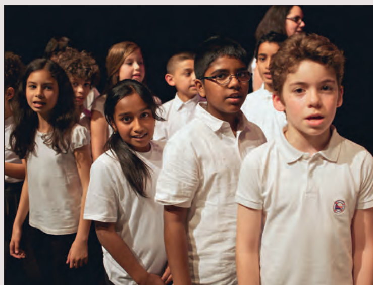
Dans la salle de spectacle du gymnase Jesse-Owens, l'ensemble vocal Soli-Tutti a interprété des chants inspirés des traditions d'Espagne et d'Amérique du sud, pour accompagner une chorégraphie contemporaine des élèves de danse d'Épinay et de Villetaneuse.