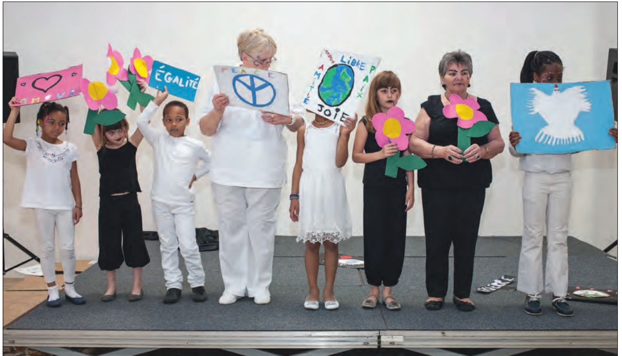
Petit spectacle intergénérationnel sur les mots de la Paix au centre socioculturel Clara-Zetkin.

« Des mots contre les maux de la discrimination » : c'était le thème du débat qui s'est tenu le 17 mai au centre socioculturel Clara Zetkin. L'événement entraine dans le cadre de la 4 e édition du Printemps de l'égalité. Depuis son instauration, ce Printemps est devenu un temps fort de la ville, qui permet des moments d'échanges entre experts et habitants, pour vivre mieux, ensemble, tout au long de l'année.